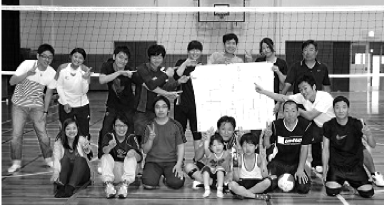
優勝した佐野支援学校のみなさん

ゆるゆるリーグには、10分会11チームが参加しました。10点先取の2セットゲームというルールのため、スピーディーな試合展開で、たくさん交流試合を持つことができました。「ゆるゆる」とはいえ、試合が始まれば熱が入り、好プレーが続出!ラリーが続くと歓声が湧き上がりました(時折笑い起こる珍プレーも?)。おさんが参加のチームもあり、アットホームな雰囲気の中、ソフトバレーボールの球の動きに翻弄されながらも、各チームと