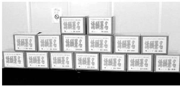
集約された府議会宛て署名

2016年度 大阪府内の市町村単独で実施する 少人数学級(予定含む)[2016年2月現在] 池田市 小3 2006年度より35人以下 富田林市 中3 2007年度より35人以下 小6 2011年度より35人以下 枚方市 小1~2 2012年度より 支援学級在籍を含めた措置 小3 2012年度より35人以下 小4 2015年度より35人以下 高槻市 小6 2012年度より35人以下 小3~6 2013年度より35人以下 豊中市 小3~6 2014年度より 課題のある学校に措置 交野市 小3~4 2014年度より35人以下 門真市 小5~中1 2014年度より35人以下 泉佐野市 小3~4 2016年度より35人以下 2017年度には小6まで35人以下学級 を拡大する予定。ただし、枚方市のような 支援学級とのダブルカウントは実施しない。 寝屋川市 小3 2016年度より35人以下