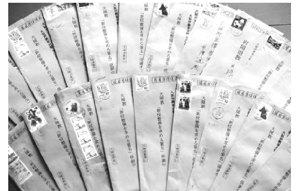
送られてきた署名入りの封筒

「支援学校の新校整備」の署名が入った封筒が、つぎつぎと大障教に送られてきます。「大障退教(大阪府立障害児学校退職教職員の会)の会員からです。