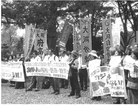
ランチタイム集会の参加者