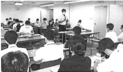
あいさつする西面委員長