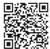
府立支援学校の実態を 写真入りで掲載