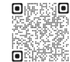
ABCテレビニュース 「ニュースおかえり」

2018年度から府立支援学校の増設を求める請願署名のとりくみをはじめ、この6年間で16万2802筆の署名を府議会に届けました。この間、府立支援学校の実態や私たちの運動